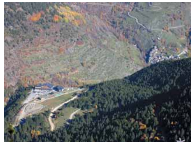
Bosc de l'Aubaga i borda de la Plana