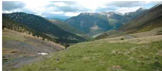
Panoràmica des de la collada de Confient

Més endavant, al Pla de la Cabana, podem veure en runes una antiga cabana de pastor, que servia al pastor per fer-hi vida mentre guardava el ramat a la muntanya.