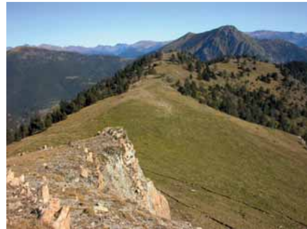
Servellà, amb el pic d'Enclar al fons