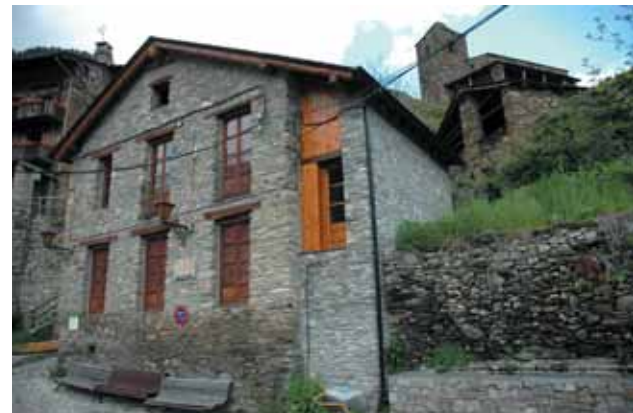
Centre de Visitants d'Os de Civís, amb Sant Pere al fons

- Des del punt d'inici de l'itinerari podrem veure a la solana una torre que s'utilitzava antigament com a colomar. Aquesta es de propietat particular i rebia un doble ús de cria de colomins per menjar i producció de fem de colom ( guano ), molt apropiat per fertilitzar els horts.